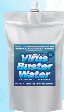
20ppm / 1000ml